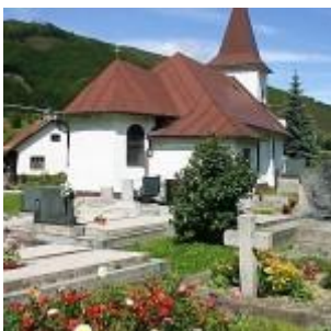
Rímskokatolícky kostol Navštívenia Panny Márie s drevenou plastikou z druhej polovice 15. storočia