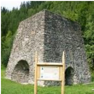
Vysoká pec v časti Tri Vody

Obec Osrblie sa môže pochváliť pamiatkami: